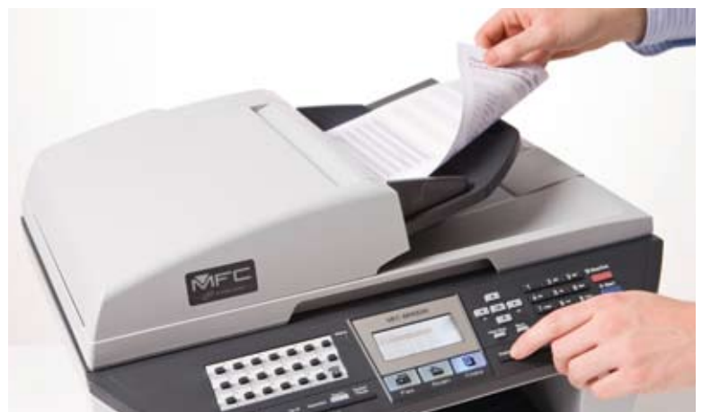
ADF: ideale per fax, copia o scansione di documenti composti da più pagine.