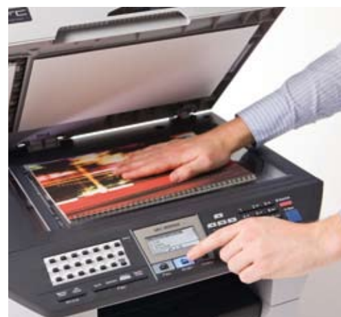
Scansione a colori di documenti in formato A4.

Fantastiche prestazioni per il vostro business: l'efficienza si caratterizza per la forte sinergia nell'MFC-8890DW dove, grazie alla gestione del risparmio energetico, al toner opzionale ad alta capacità e alla stampa, alla copia, al fax e allo scanner in fronte-retro il risparmio dei costi è garantito.